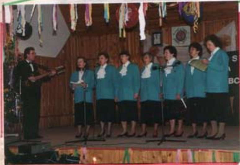
Występ zespołu "Sennado" = Gładina