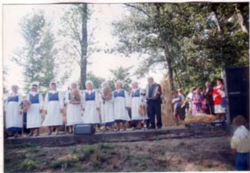
Występ zespołu „Winniczanki” na Gminnych Dożynkach w Kramsku