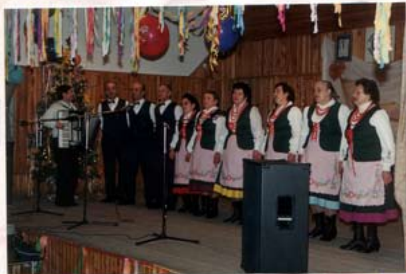
Występ zespołu ludowego „Wielopolanki” z Helenowa