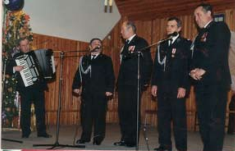
Występ zespołu „Słowiki z Kramaska”