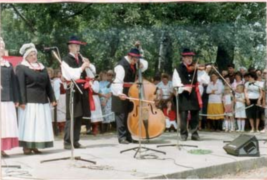
Występ zespołu „Świętojanki” na XI Wojewódzkim Przeglądzie Kapel i Zespołów Ludowych '94