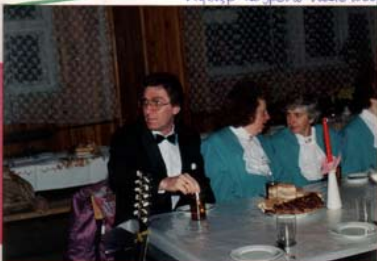
Spotkanie z kombatantami przy wspólnej herbacie