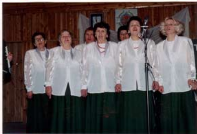
Występ zespołu ludowego „Winniczanki”

Dnia 18.01.1995 w OUK w Kramsku odbyło się spotkanie z okazji Dnia Babci i Dziadka. Podczas spotkania wystąpiła młodzież szkółka dotycząca historii słowno muzyczny pt. Herbatka z babcią i dziadkiem oraz zespoły ludowe działające przy OUK. Spotkanie upłynęło w miłej atmosferze przy wspólnej herbatce i ciastku.