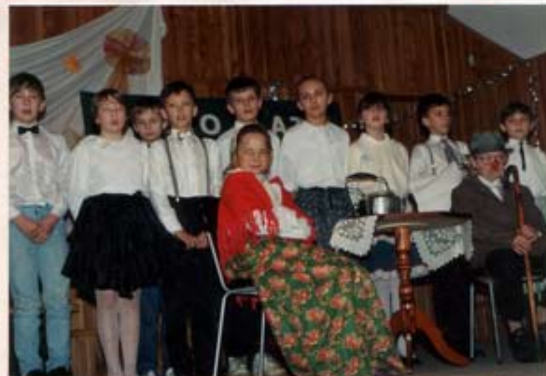
Występ młodzieży szkolnej w montażu słowno-muzycznym „Herbatka z babcią i dziadkiem”