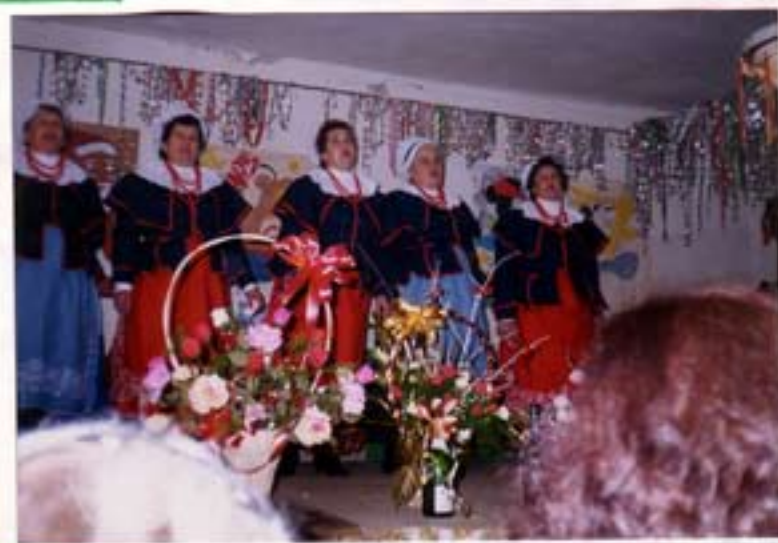
Zespół „Wielopolanki” z Helenowa