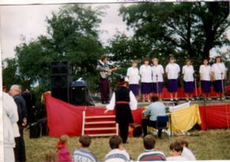
Występ zespołu "Serenada" z Grablina na Dożynkach w Złotkowie