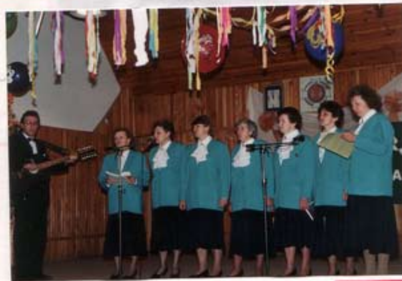
Występ zespołu „Serenada” z Grąbłina