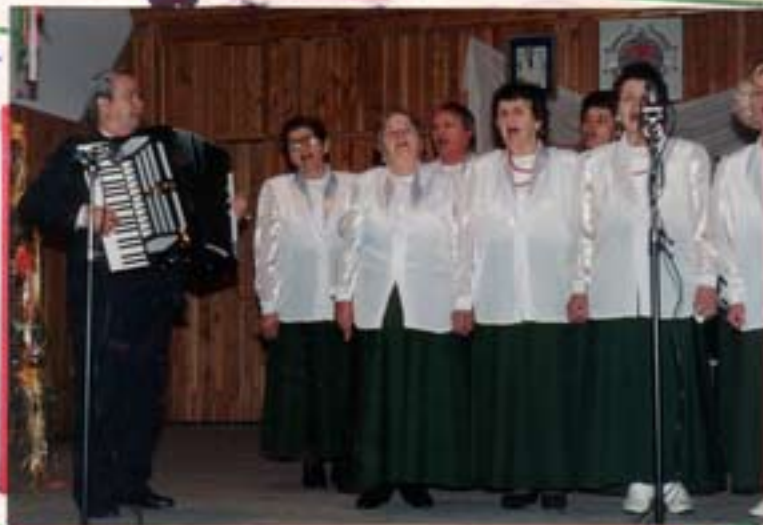
Występ zespołu ludowego „Winniczanka”