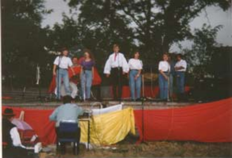
Występ zespołu młodzieżowego ze Świątca gm. Kramok