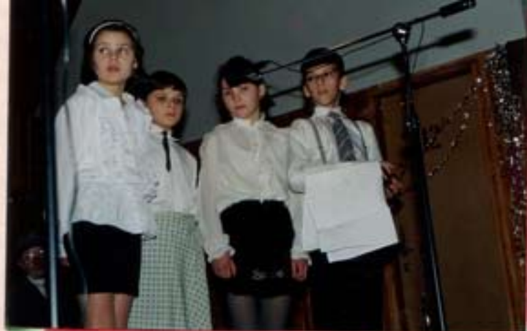
Młodzież szkolna w montażu własno-muzycznym pt. "Wolność dotarła i do nas".

Uczestnicy walk wyzwoleniczych przybliżyli nam swoimi barwnymi wspomnieniami te tragiczne dni naszej historii.