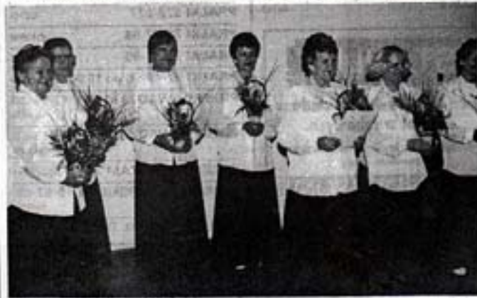
Zespół „Winniczanki” ciągle w świetnej formie.