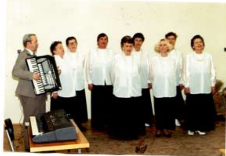
Występ zespołu ludowego „Winniczanki”