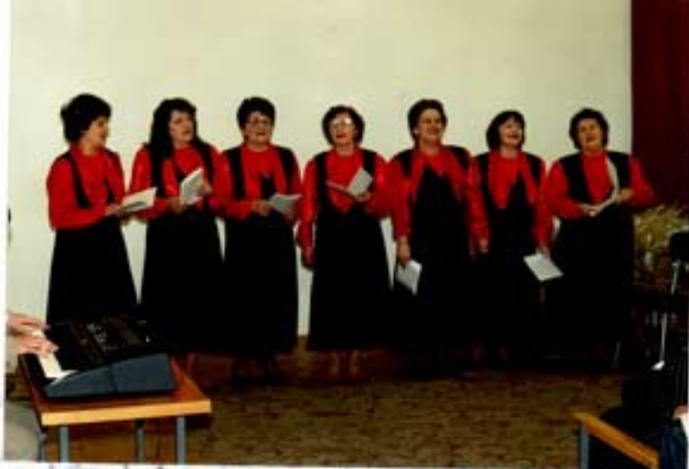
Występ zespołu „Słoni Słoni” z Kwamka