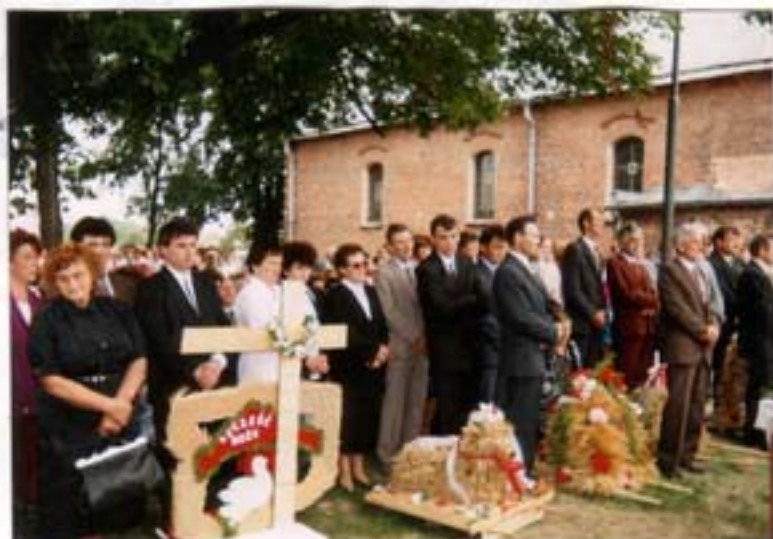
Prezentacja wienca dożynkowego - Złotkowie