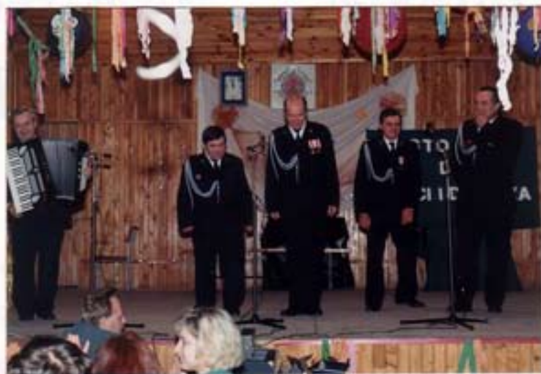
Zespół "Stawki" z Kramuska