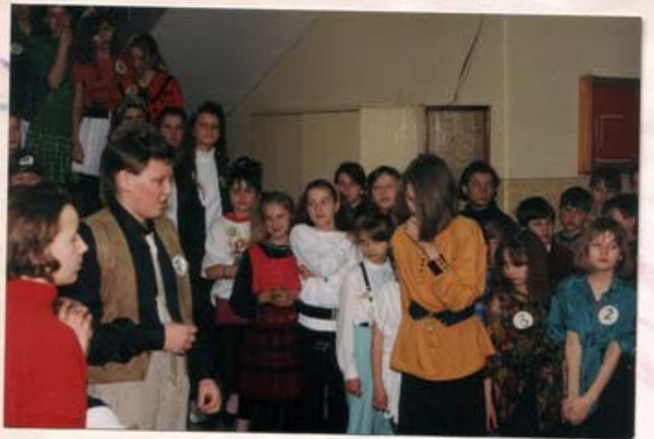
Zabawy z dziećmi

W okazji Dnia Seniora w Urzejewie gościnnie wystąpiły "Sami-Swaci" z Kramską oraz "Stowiki" Kramsk.