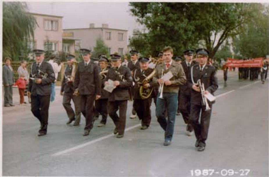
Orkiestra dęta OSP Kramsk