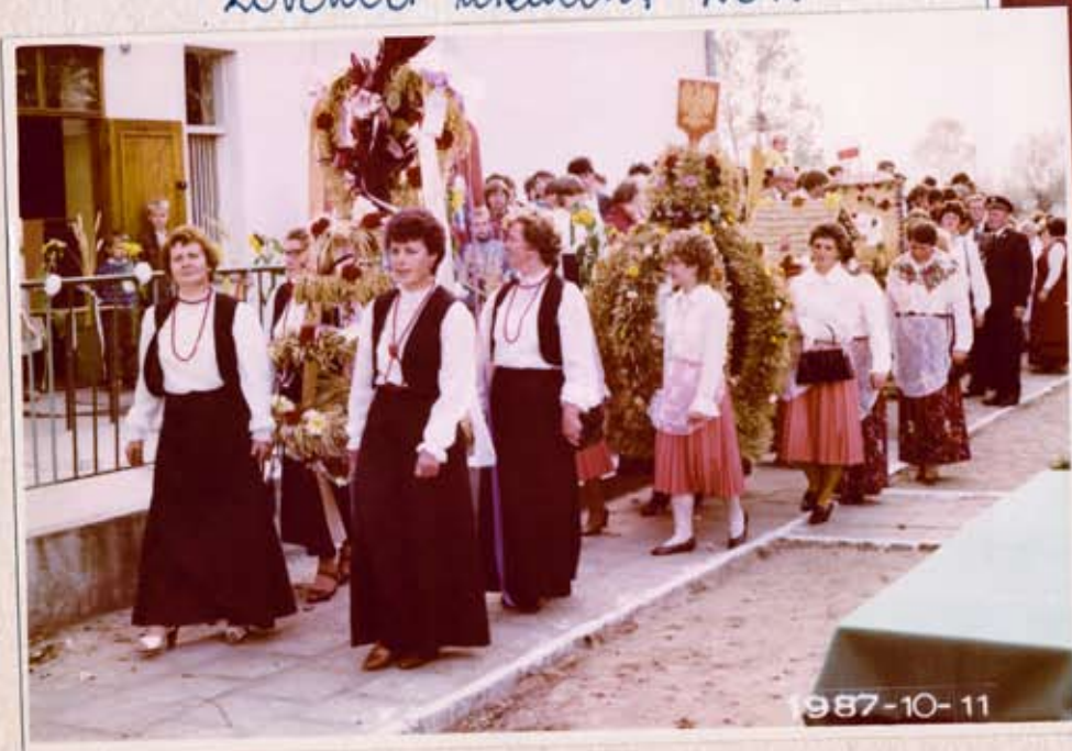
Korowód wieńczący KGW

odbyły się 11. 10. 1987 roku w Patrzykowie.