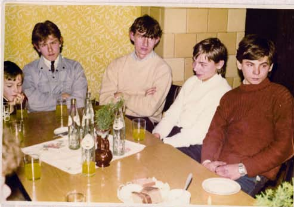
Uczniowie biorący udział w spotkaniu.