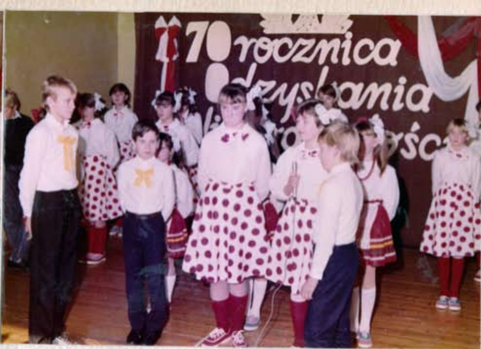
Występy dzieci ze Szkoły w Patrzykowie