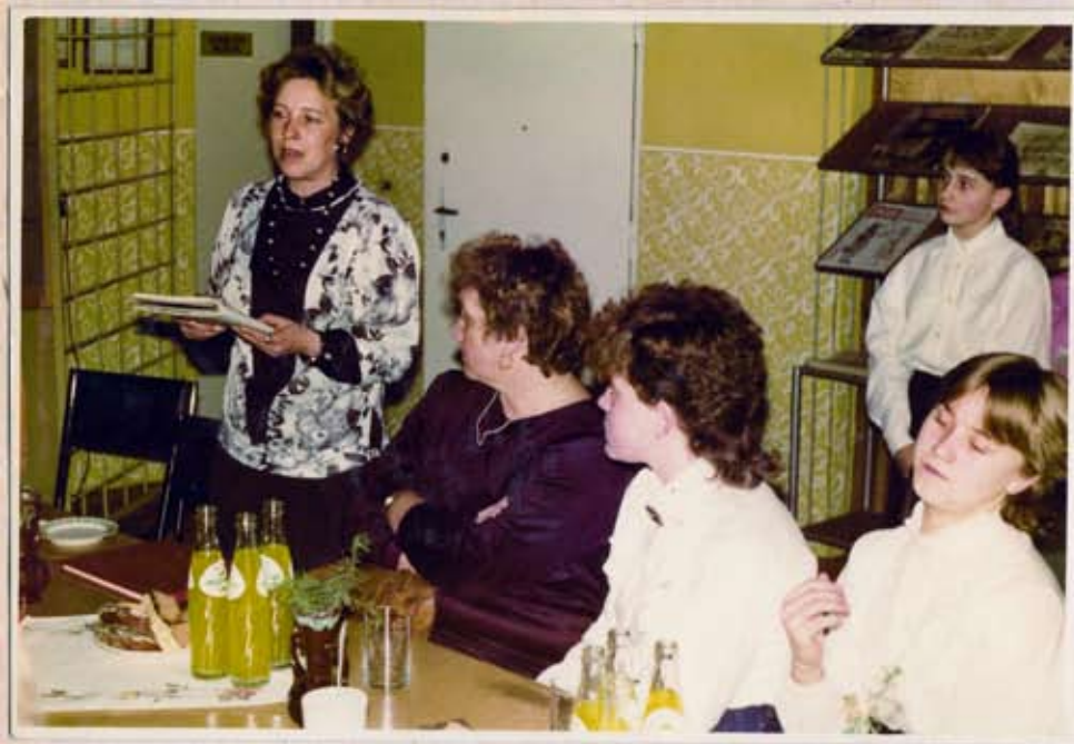
Młev G BP przedstawia krótką informację na temat Wyzwolenia Ziemi Kowińskiej