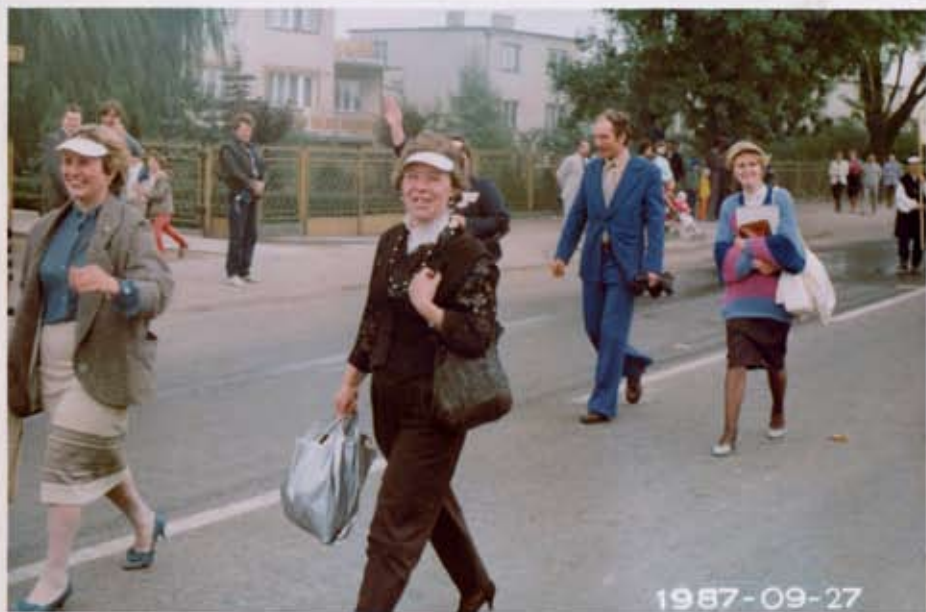
Mdział zakładów pracy w kowalstwie.