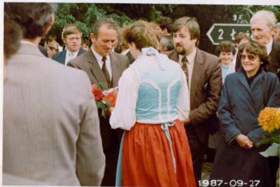
Powitanie uczestników Pałovanamy w Strážkowie.