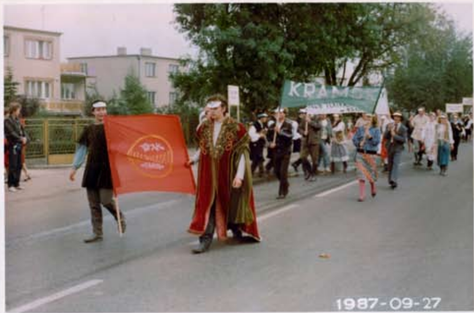
Korowód Gminy Kramsk z okazji Panowamy