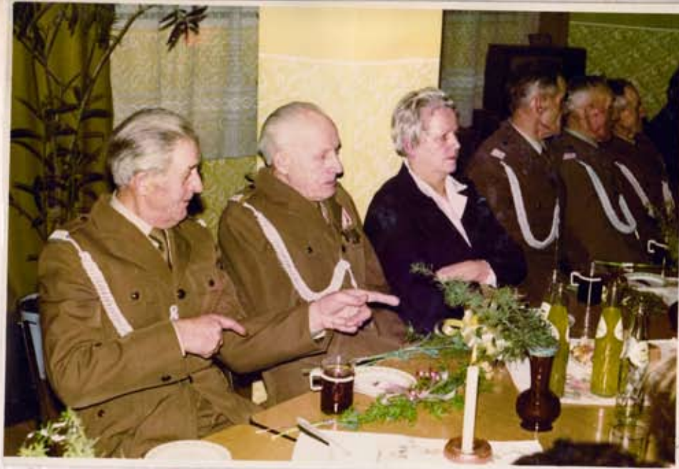
Honowowi goście spotkania kombatanów