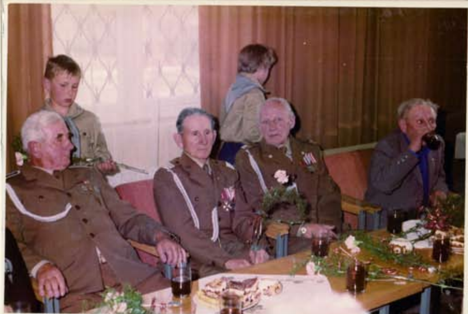
Zaproszeni goście i uczestnicy spotkania