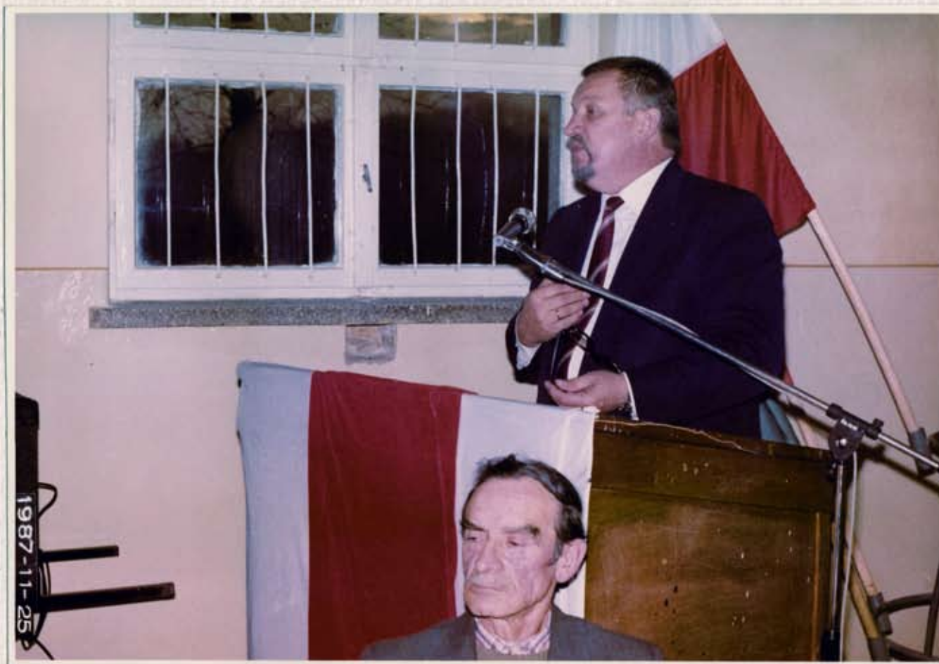
Wystąpienie Tadeusza Szlachowskiego - zastępcy Przewodniczącego Rady Państwa, członka Prezydium NK ZSL