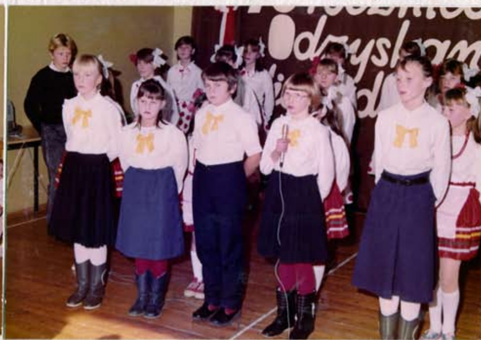
Występy dzieci ze Szkoły w Woli Podgórnej.