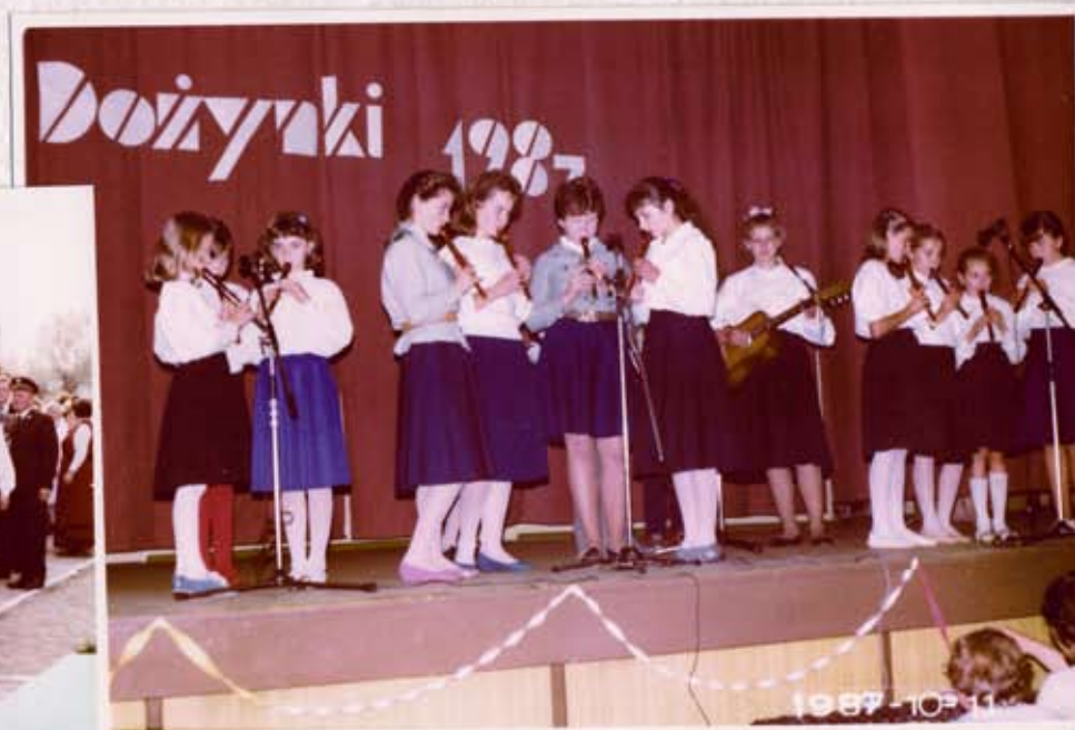
Występ młodzieży szkolnej z Kwamie