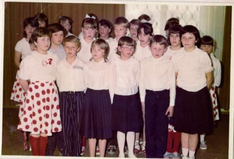
Dzieci w trakcie swojego występu artystycznego