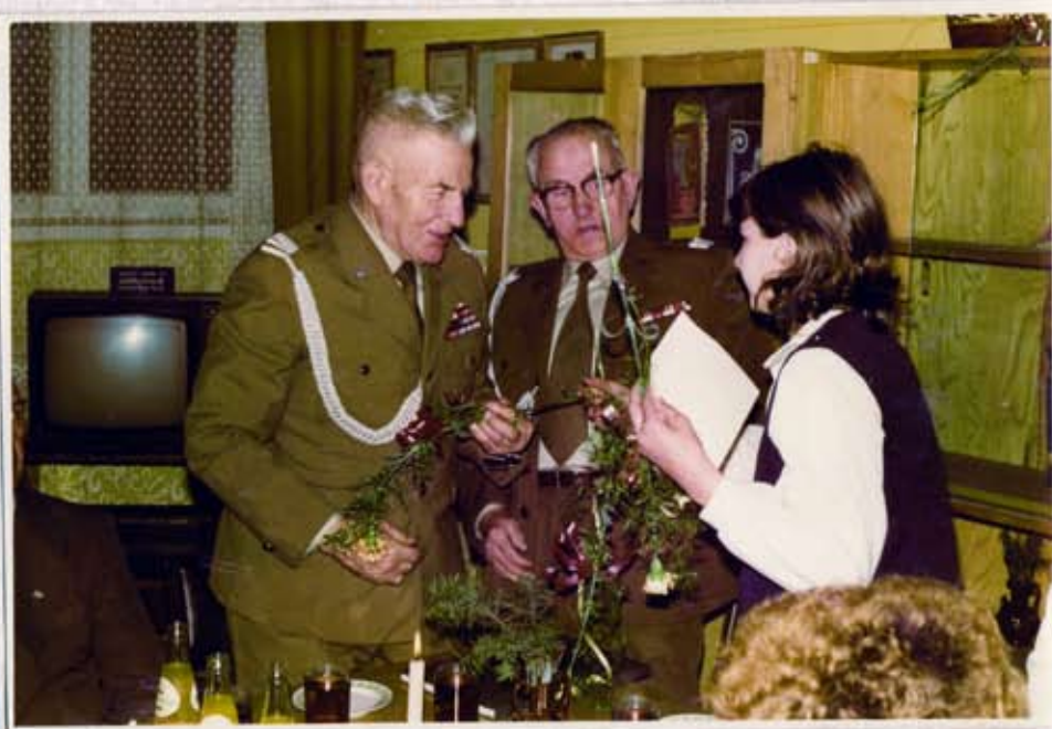
Wwęczenie symbolicznego kwiatka