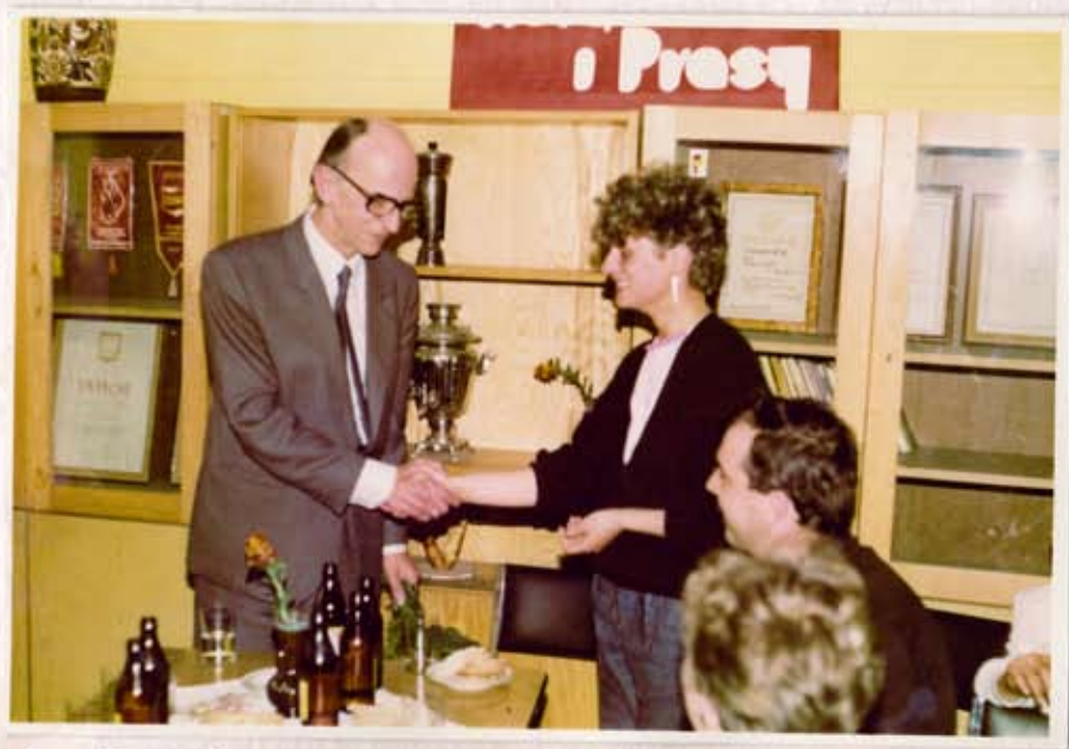
Spotkanie z pisarzem Januszem Przybysem