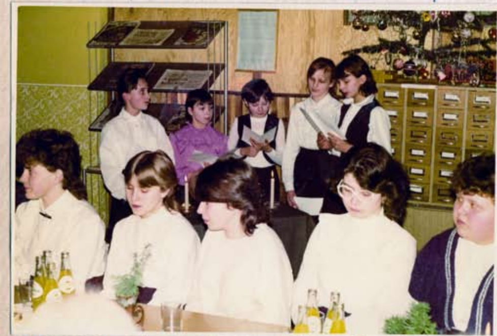
Młockież w trakcie montażu stownego