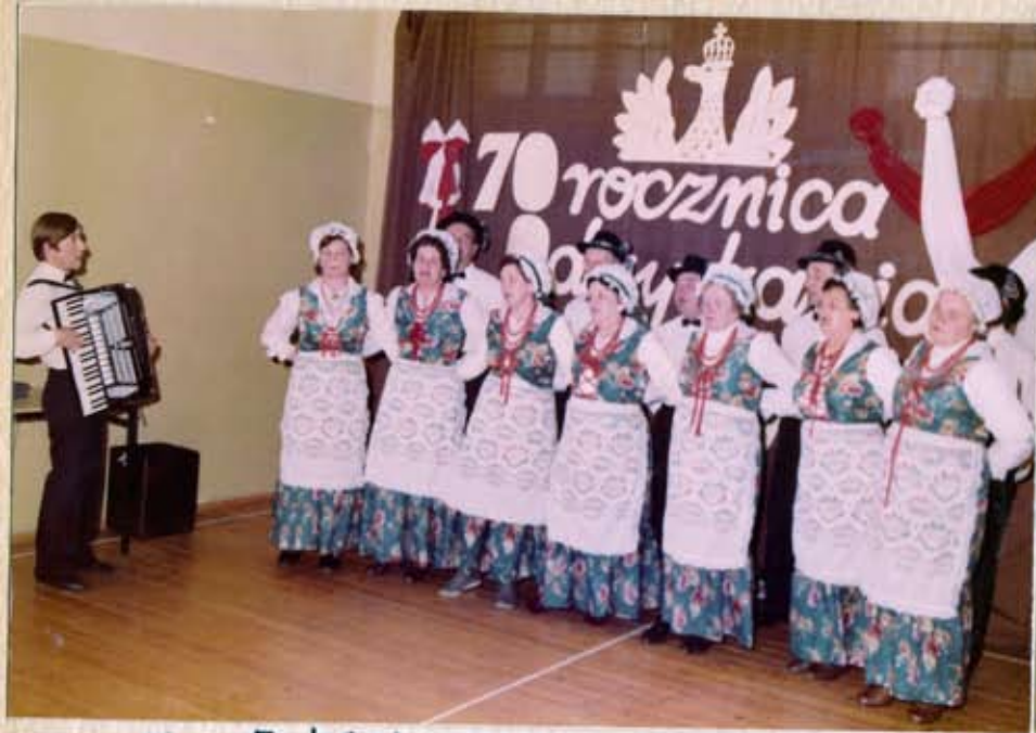
Zespół KGW z Helenowa