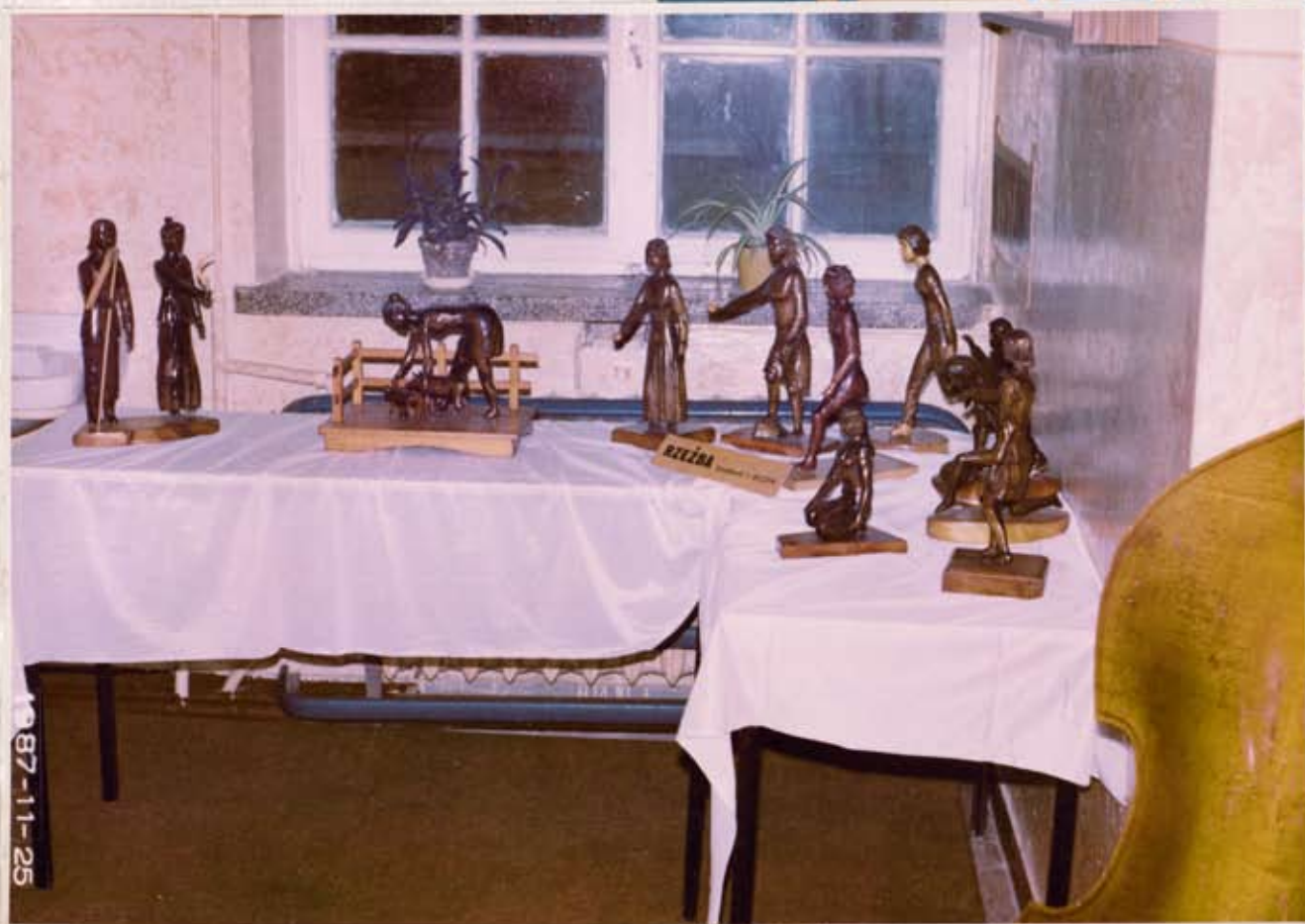
Wystawa rzeźby, twórcy Ludowego Mama Szustakowskiego prezentowana z okazji Między ZSL