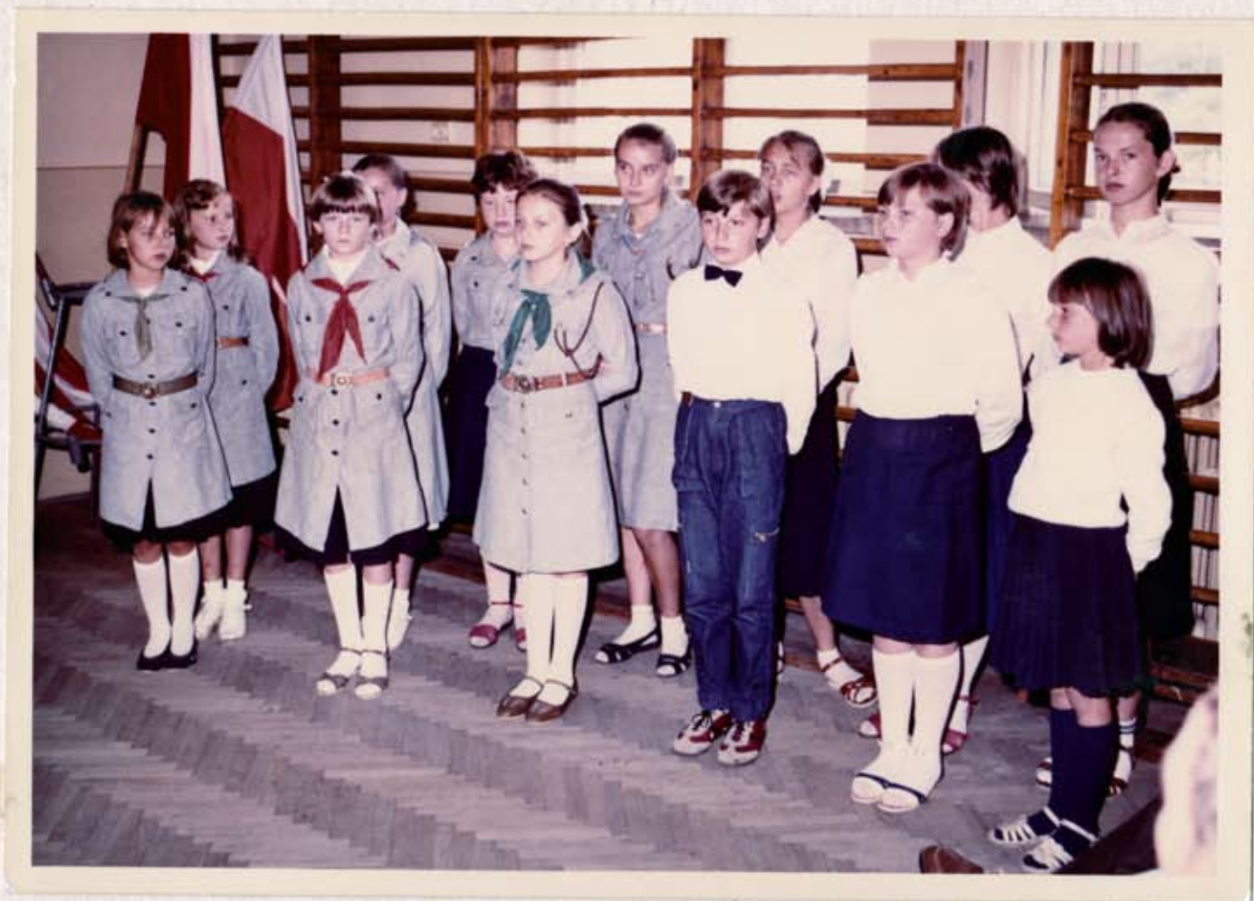
Występ młodziaków z Kwamska podczas uroczystości 22-lipca.