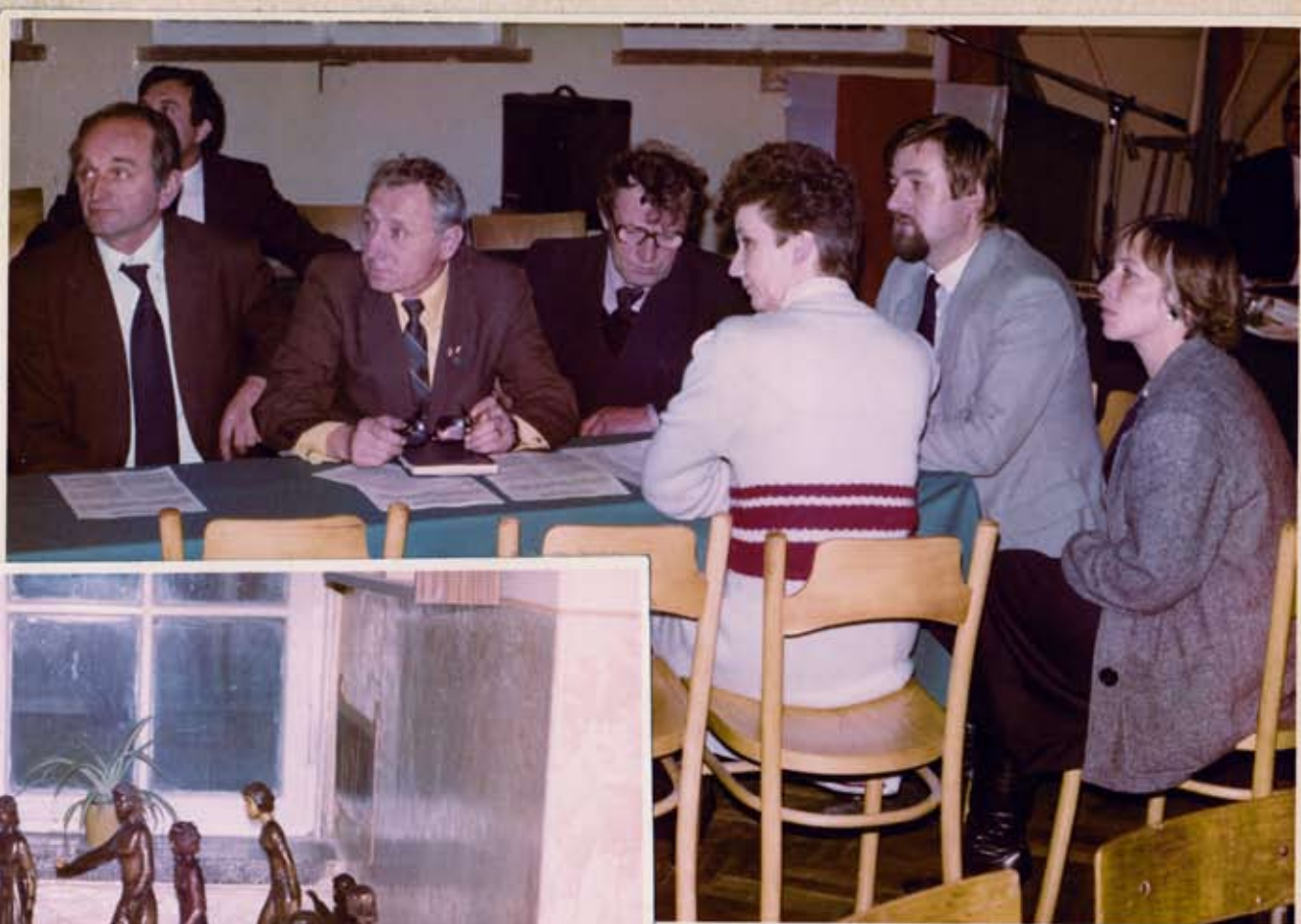
Pierwsze posiedzenie nowo wybranego Prezjolum GK ZSL Kwamsk