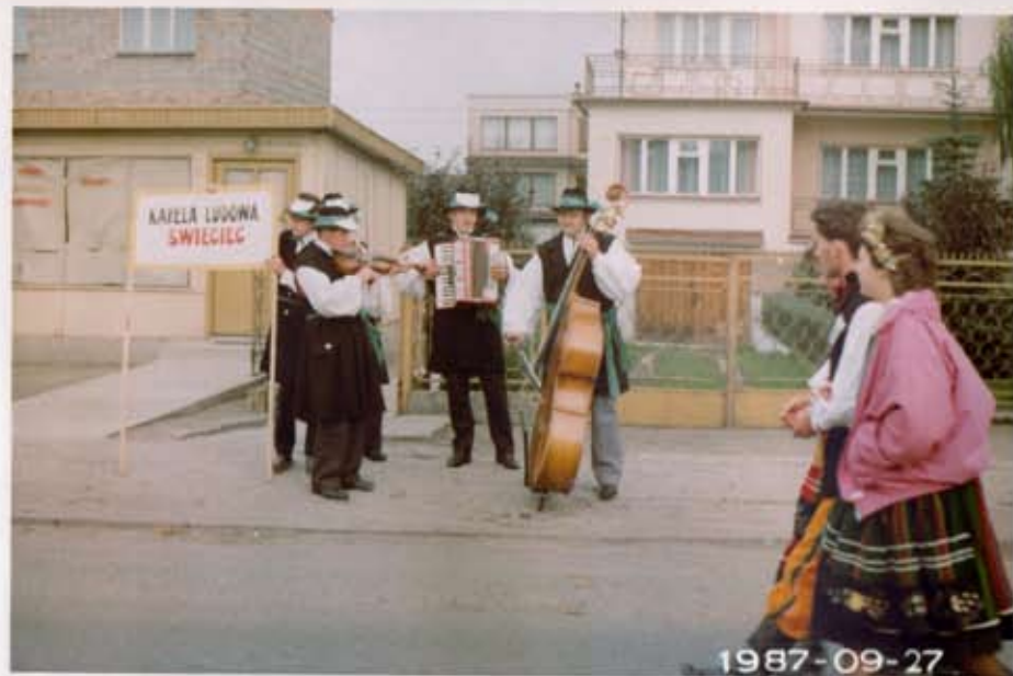
Kapela ludowa ze Świecica