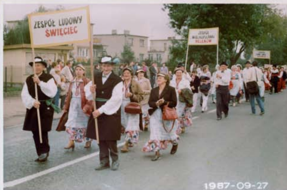
W korowódzie iola zespoły ludowe.